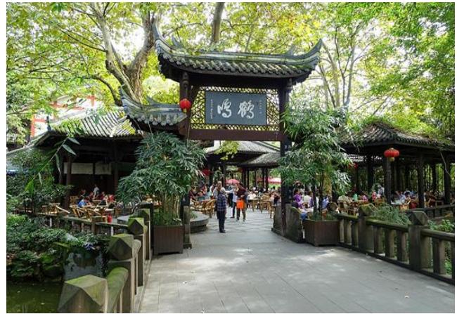
鶴鳴茶館