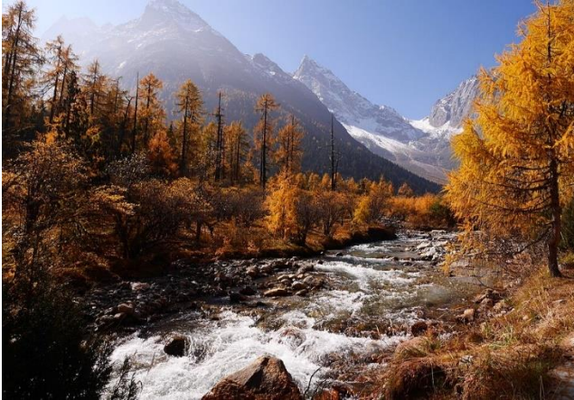
畢棚溝風景區