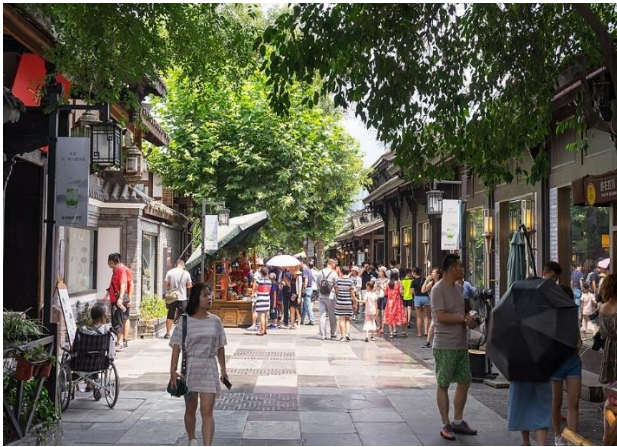
寬窄巷子