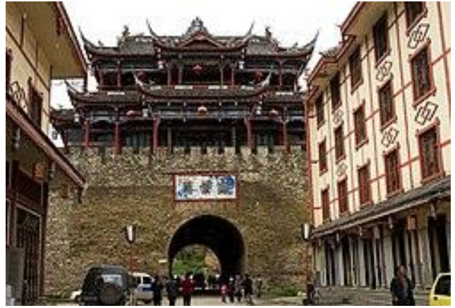
松潘古城