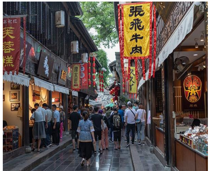
錦里古街