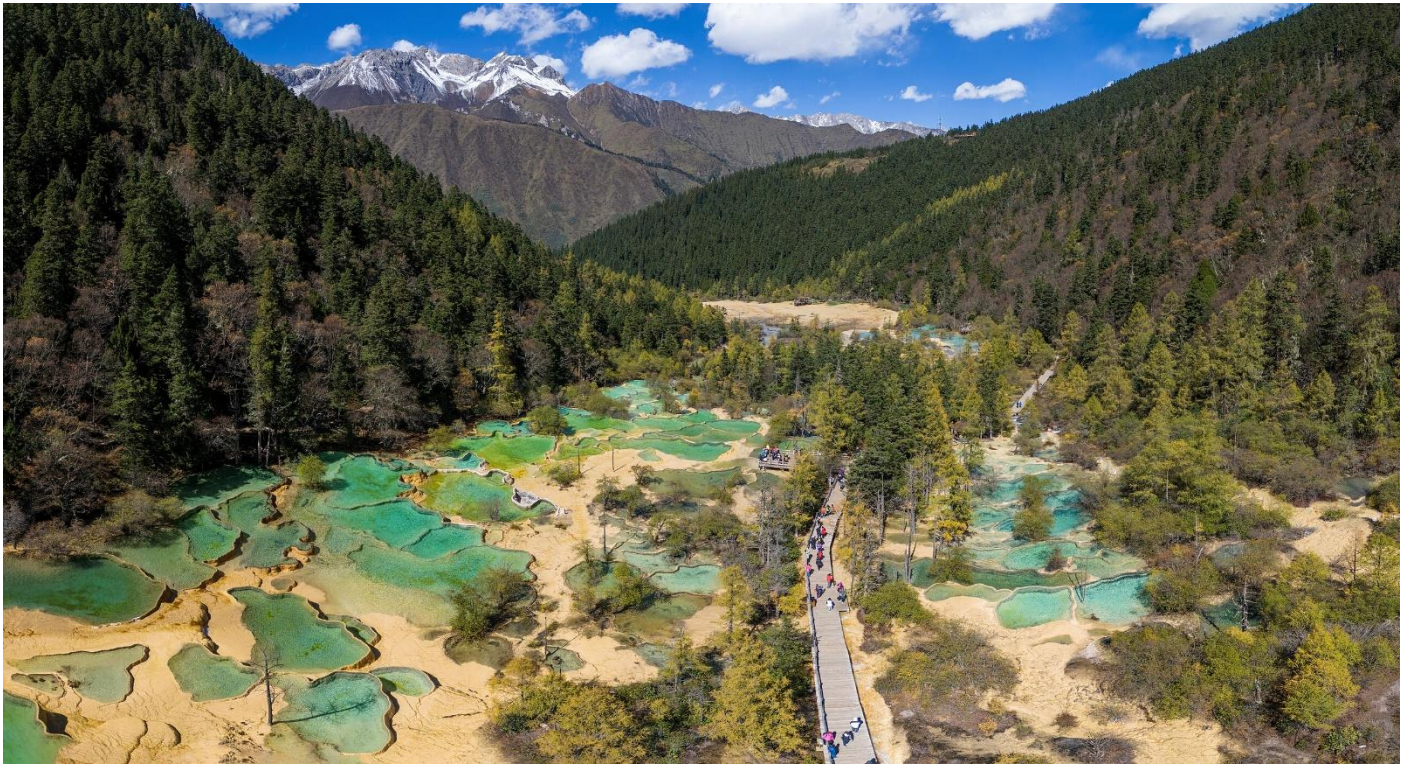
黃龍風景區