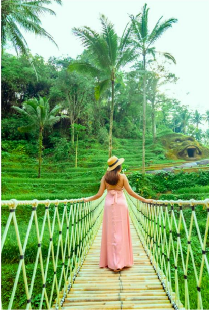
德哥拉朗 梯田 TELAGALANG RICE TERRACE