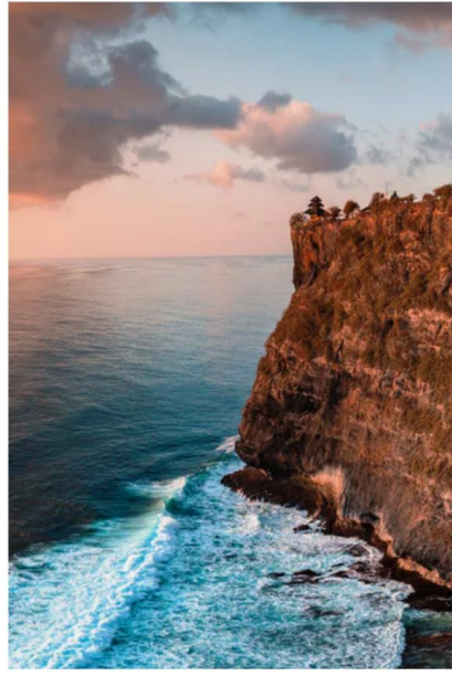
- BALI - ULUWATU